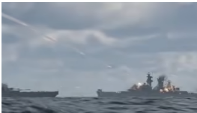
Deze beelden komen uit het videospel War Thunder.

Bijna alle fictieve beelden van de twee Iranoorlogen komen uit videospelletjes: twee beelden uit War Thunder, twee andere beelden uit Arma 3 en World of Warships en een beeld uit een niet nader gespecificeerde militaire simulator. Een laatste beeld is een 3D-simulatie van een militaire basis onder een Israëlisch ziekenhuis die uit een satirische video komt.