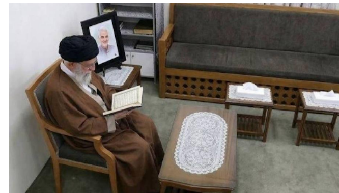
Deze foto van ayatollah Ali Khamenei is waarschijnlijk bewerkt.

De twee bewerkte beelden van de Iranoorlog uit 2026 zijn een foto van de zogenaamde laatste momenten van ayatollah Ali Khamenei , die bewerkt is en gebaseerd is op foto's uit 2023, en een video uit Teheran waarin feest gevierd wordt en een Israëlische vlag op een gebouw wordt geprojecteerd die achteraf is toegevoegd.