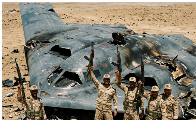
Iraanse soldaten en de B-2 bommenwerper die zij hebben neergehaald, zijn door AI gegenereerd.

Bij de oorlogen in Iran zagen we veel AI-beelden terug, waarvan de meeste explosies en andere verwoesting lieten zien. Een video van Iraanse raketinslagen in Israël is met AI gemaakt, net als drie clips van Israëlische bombardementen in Iran tijdens de Twaalfdaagse Oorlog. Een korte video van een ontploffing van de Evin-gevangenis in Teheran is nep